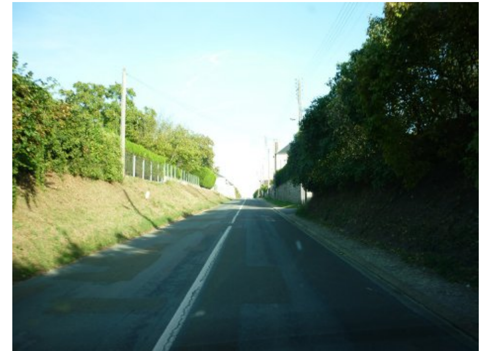
Dans la dernière montée avant l'arrivée au niveau de l'église, seules les clôtures du lotissement, à gauche, sont perceptibles. Le lotissement est donc plutôt bien intégré.