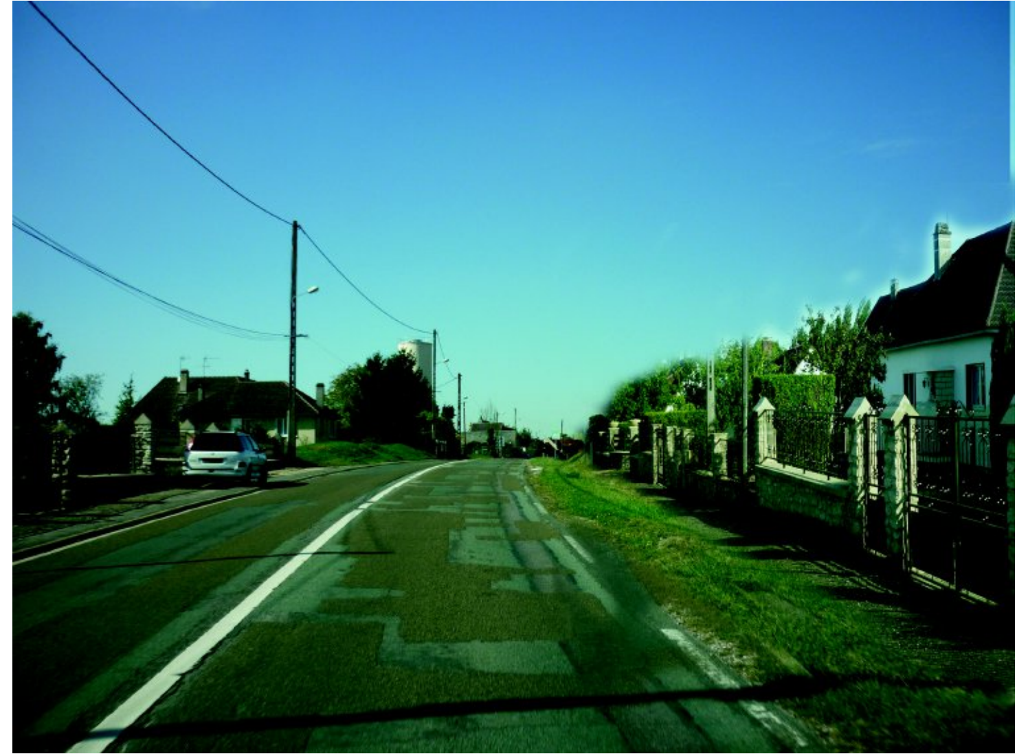
Etat construit : Une accentuation de la banalisation du paysage villageois ?