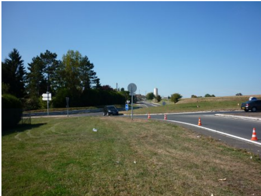
Le seuil d'entrée est. Les constructions les plus récentes se situent sur la gauche. Elles sont peu perceptibles. La partie droite, non bâtie, offre un horizon dégagé. La construire modifierait de façon importante la silhouette du bourg en la banalisant.