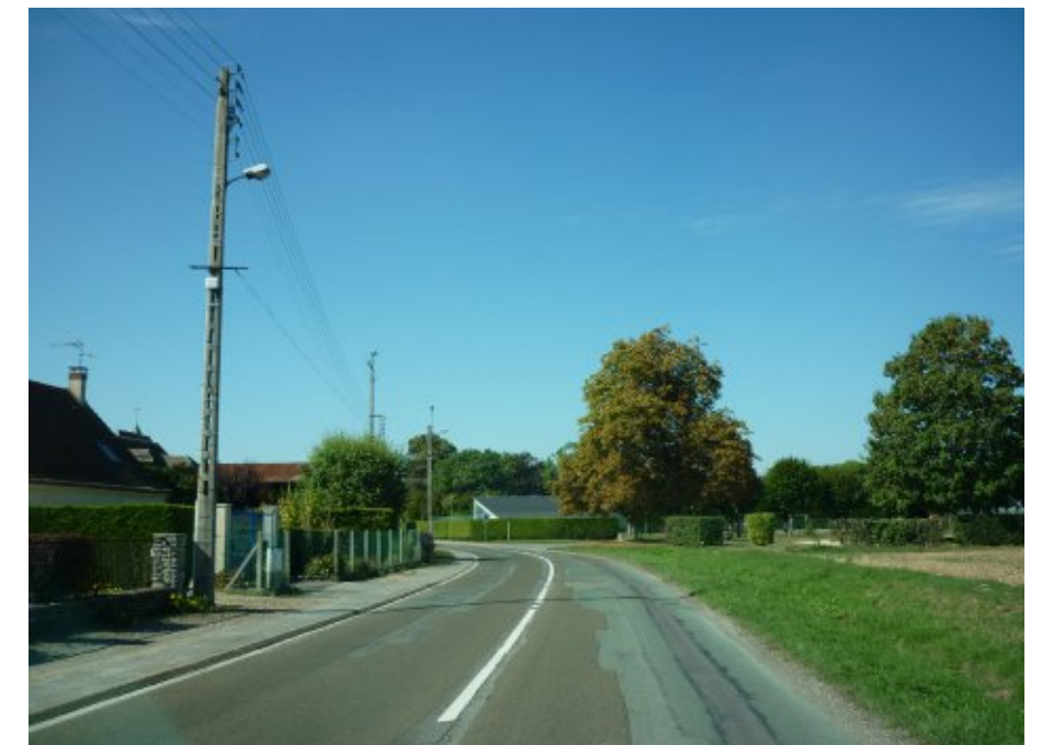
Cette dernière séquence de l'accès par l'est se situe avant la découverte de l'église. La partie nord n'est pas bâtie et laisse place à une composition urbaine marquée par la présence de grands arbres repères. En arrière plan, le parc de la maison bourgeoise complète cette ambiance verdoyante. L'implantation de constructions, côté nord, modifierait de façon importante l'ambiance générale de cette dernière séquence. Ces constructions seraient de plus perceptibles depuis l'église.