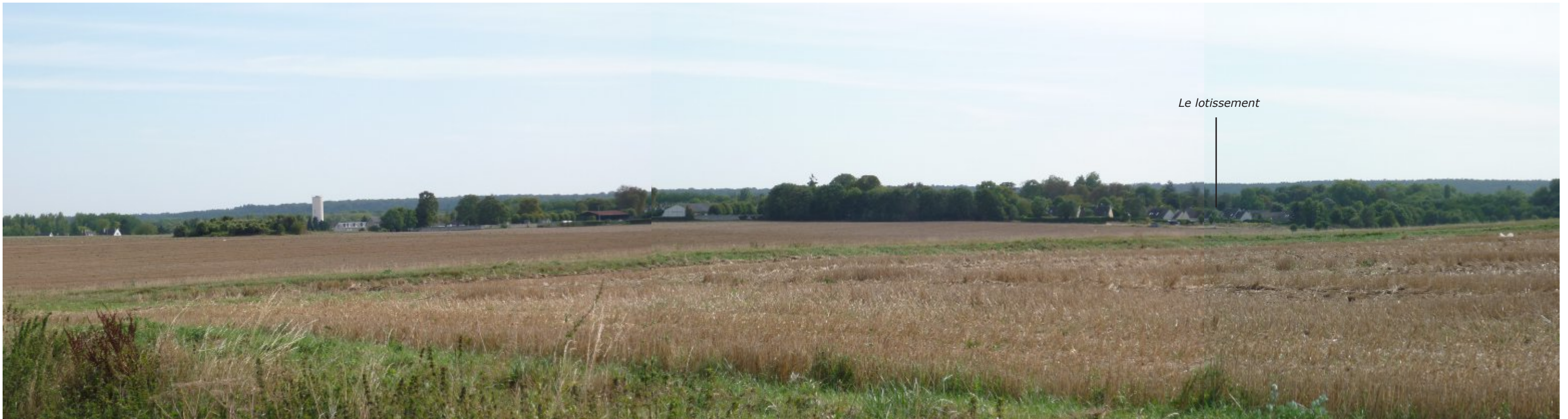
La silhouette du bourg vue du nord est encore bien homogène. Les constructions récentes existantes s'intègrent dans la masse boisée des jardins et de l'arrière plan. Il n'en serait pas de même pour des nouvelles constructions en rive nord de la route de Nanteuil.