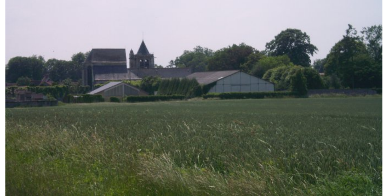
Vue du centre-bourg depuis le nord. L'église émerge au dessus des toits de la salle polyvalente et du bâtiment d'activité. Les hauteurs de ces bâtiments sont importantes. La multiplication de ce type de bâtiment ou de hauteur nuirait définitivement à la silhouette du bourg. Cependant leur impact est ici atténué par leur implantation en contrebas et la présence du parc de la maison bourgeoise.