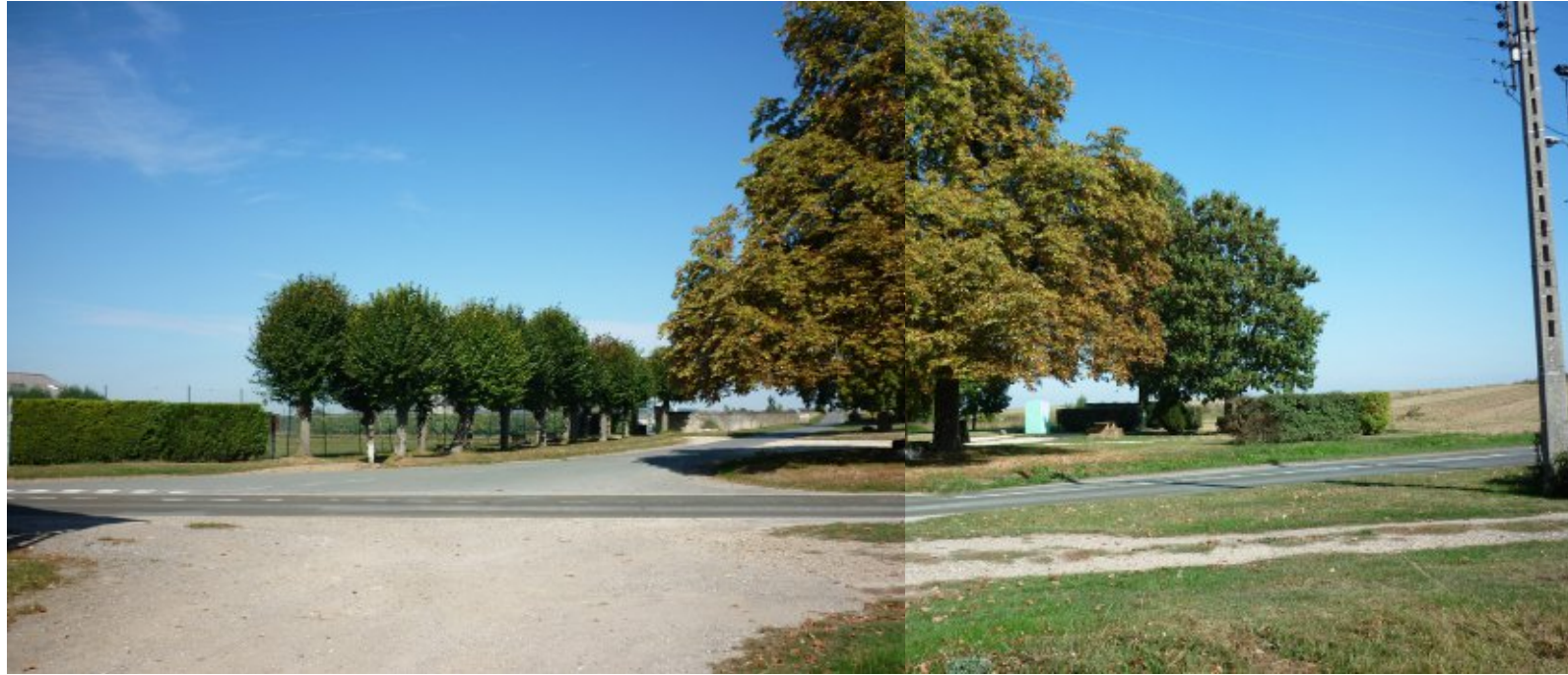
Un seuil d'entrée nord resté très ouvert. Le cimetière marque le début de l'urbanisation vers l'ouest. Il peut aussi en devenir une limite durable.