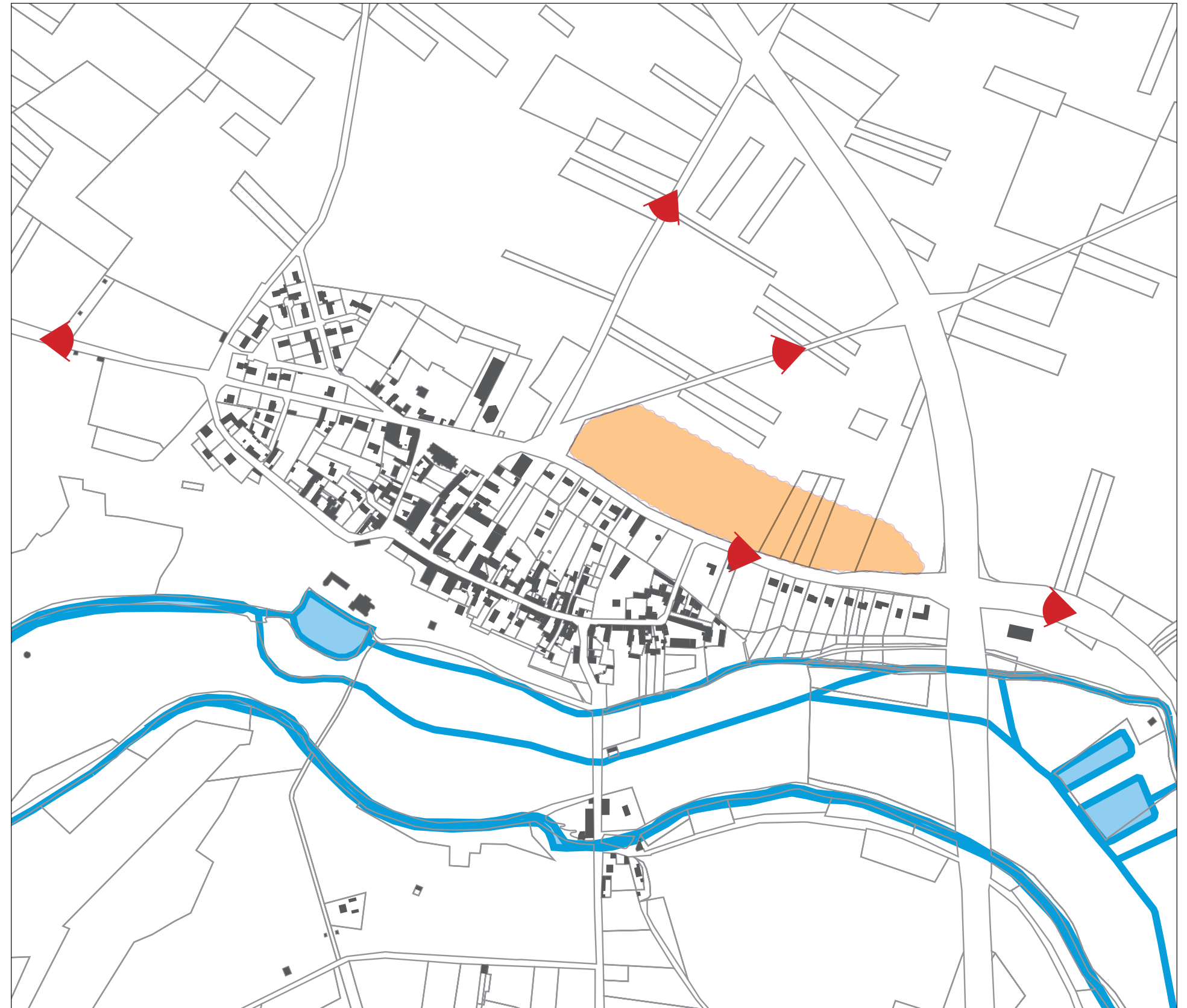
Repérage des secteurs dont la construction impacterait de façon négative sur les silhouettes du bourg