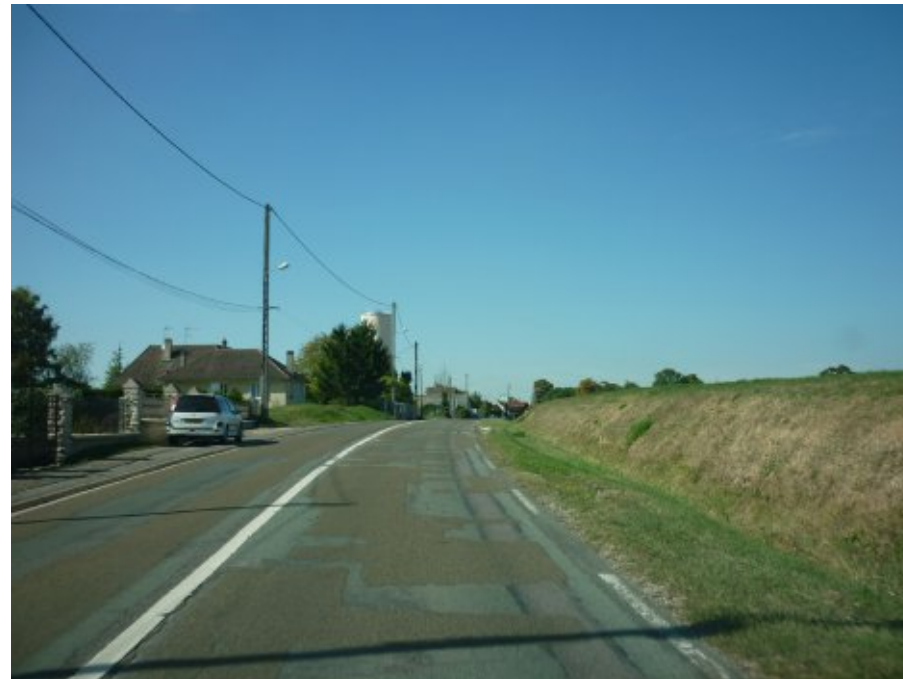
Dans cette seconde vue des séquences d'entrée par l'est, on remarque nettement la différence de niveau entre la rive sud de la route et la rive nord. Cette dernière se situe en contre-haut. Son urbanisation impliquerait de modeler le terrain pour réaliser les accès et les constructions seraient situées en hauteur. Elles n'en seraient donc que plus impactantes sur la silhouette du bourg.