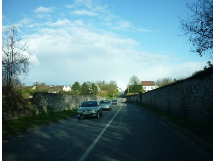
Les murs cadrent toujours les vues mais le lotissement, à gauche, et la maison de droite, très claire, deviennent perceptible.