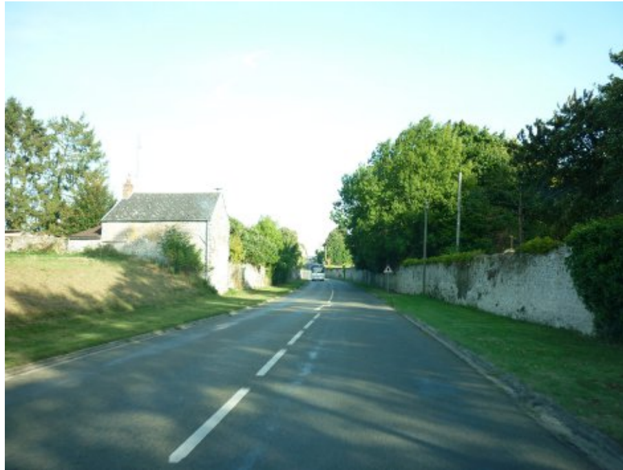
Un seuil d'entrée ouest, encadré par les murs de clôture. Il a conservé un caractère authentique.