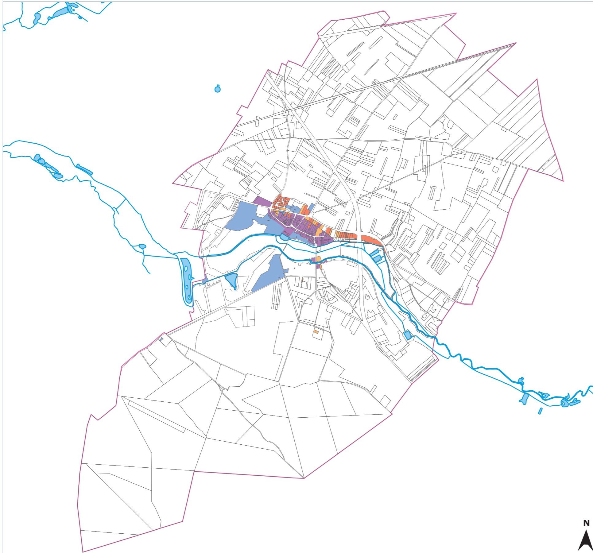
Carte des grandes périodes d'occupation des parcelles par des constructions.